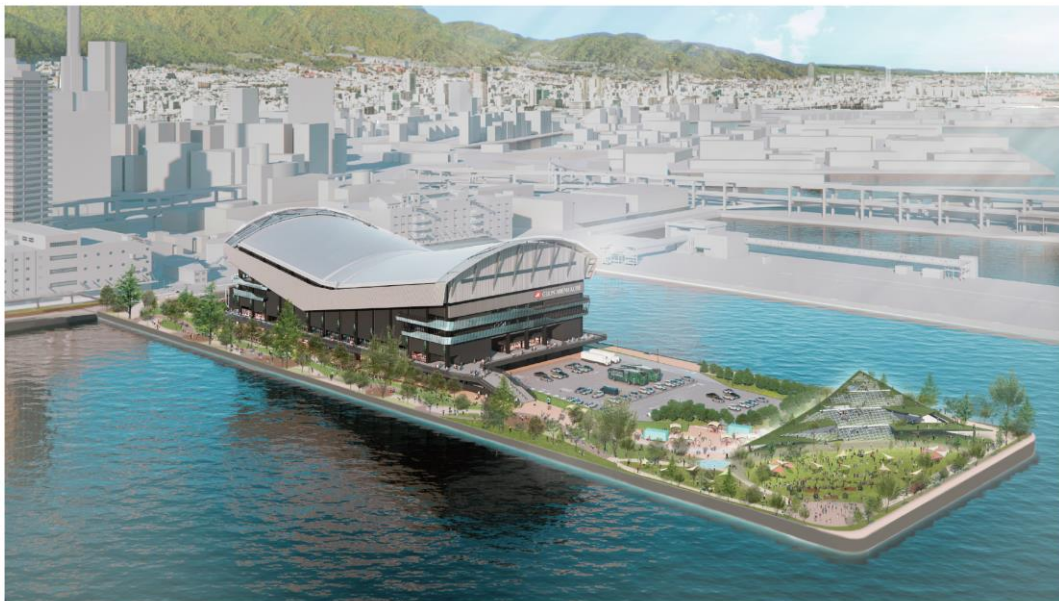
GLION ARENA KOBE と TOTTEI エリアの鳥瞰イメージ