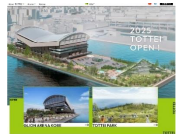
TOTTEI 公式ホームページイメージ