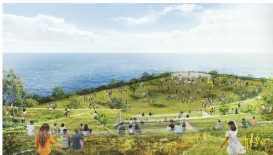
TOTTEI PARK 緑の丘イメージ

国内初「港湾環境整備計画」の認定を受け、港を緑化したシンボリックなパークを官民一体で整備します。（※1）神戸ウォーターフロントならではの景色・体験を叶え、イベント時に観客席にもなる「緑の丘」状の建築物を建設予定です。