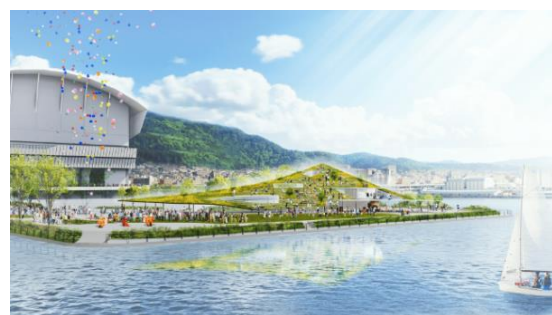
海からの TOTTEI PARK イメージ

270度海に囲まれたロケーションで神戸の港と六甲山の山並みを五感で感じられるスポットのほか、365日「ここに来ると何かがある」神戸のエンターテインメント最先端エリアを目指します。