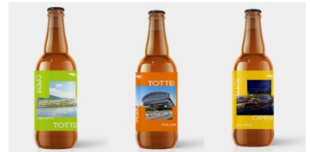
開業1年前記念 オリジナルクラフトビールイメージ

ブースでは、開業より一足早くアリーナの内部や周辺エリアを3D体験できるコーナーや、TOTTEI愛称の発表を記念して「新アリーナイメージラベル」のオリジナルクラフトビールを特別販売いたします。B.LEAGUE「神戸ストークス」とGLION ARENA KOBEのコラボうちわプレゼント（先着5,000名）もありますので、ぜひお立ち寄りください。