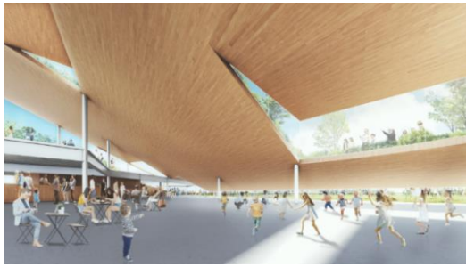
緑の丘の内部イメージ