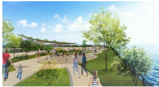
アリーナからパークへ続く遊歩道イメージ

緑の丘状の建物内には、全天候型の緑や木々が感じられる多目的スペースをご用意。新しいBBQの形を追求するレストランや、オリジナルクラフトビールを醸造するブリュワリー等、唯一無二のダイニング体験を提供予定です。