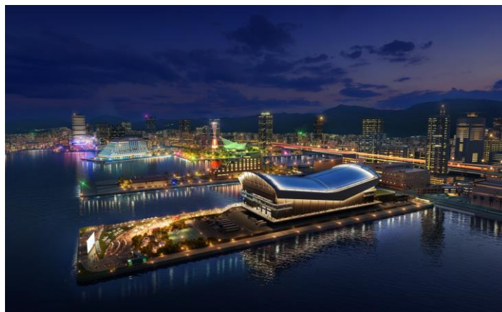
神戸アリーナ（仮称）夜景イメージ

アリーナ周辺エリアでのご当地マルシェや子育て世代のコミュニティ作りを促進するイベント実施等、デジタルプラットフォームをベースに「参加する人と人、人とまちがつながり神戸の魅力を体感できる取り組み」の共創を予定しております。また、企業のオープンイノベーションやスタートアップによる社会課題解決に繋がる取り組みを推進するコミュニティの創発にも努めて参ります。