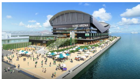
神戸アリーナ（仮称）にぎわいイメージ

また、本プロジェクトにご賛同いただける企業・団体の皆様やアリーナの各種ネーミングライツパートナーを募集中です。ご興味のある方は <お問合せフォーム> からご連絡ください。